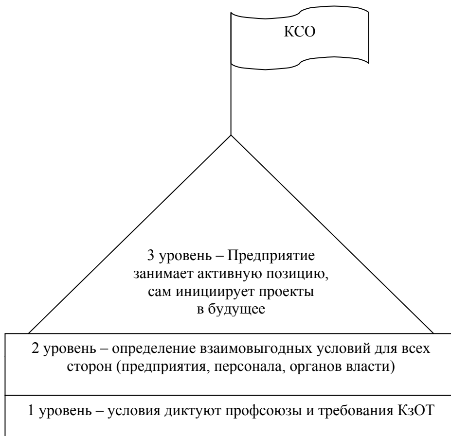
Рис. 2. Уровни корпоративной социальной ответственности

Различные разработки стандартов и методик в области внедрения на предприятиях практики социальной ответственности проводят организации: